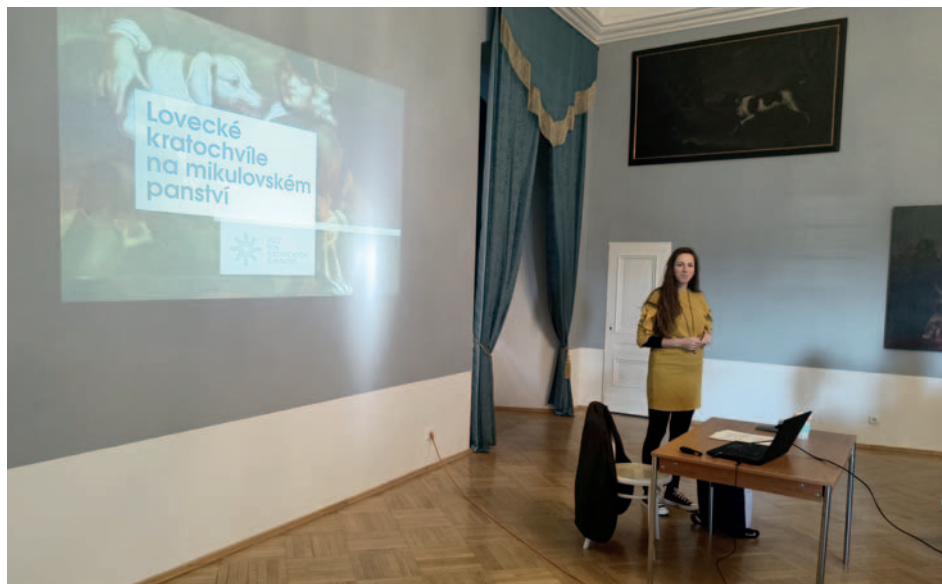
V Loveckém sále mikulovského zámku proběhl na podzim v rámci Roku šlechtických slavností cyklus pěti podzimních historických přednášek.

V Loveckém salonu mikulovského zámku se tak sešlo 23 obecních a městských kronikářů, s nimiž přijelo také několik starostů. Na programu byla prezentace Muzejního