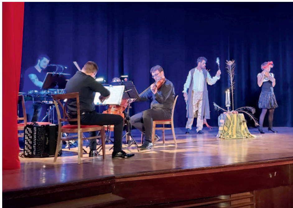
Desátý ročník Festivalu barokního divadla Moravský Parnas Johanna Georga Gettnera a představení na zámku – Ensemble Opera Diversa s trojicí minioper Grobláni a Geisslers Hofcomedianten s nově barokním muzikálem Pudl a pudr aneb Fantastické počátky barokního divadla v Čechách.