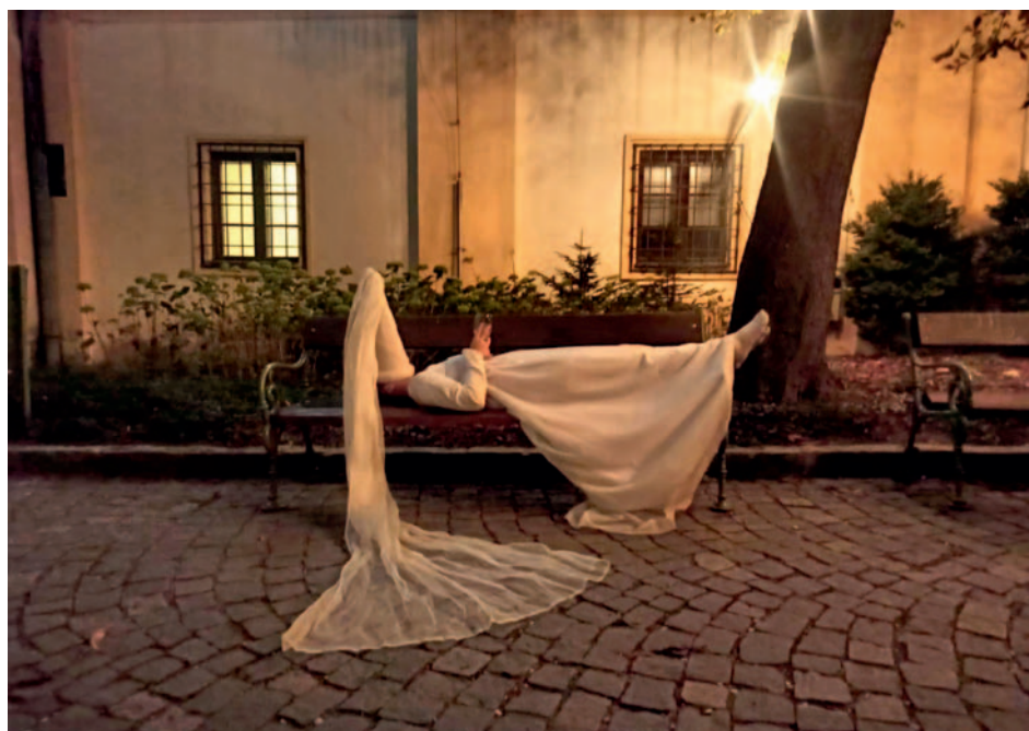
Pani Perchta z Rožmberka, nešťasně provdaná za Jana V. Liechtensteina na mikulovský hrad, se dle jezuitů Bohuslava Balbína zjevuje na bývalých sídlech pánů z Růže. Skutečnost je však jiná...