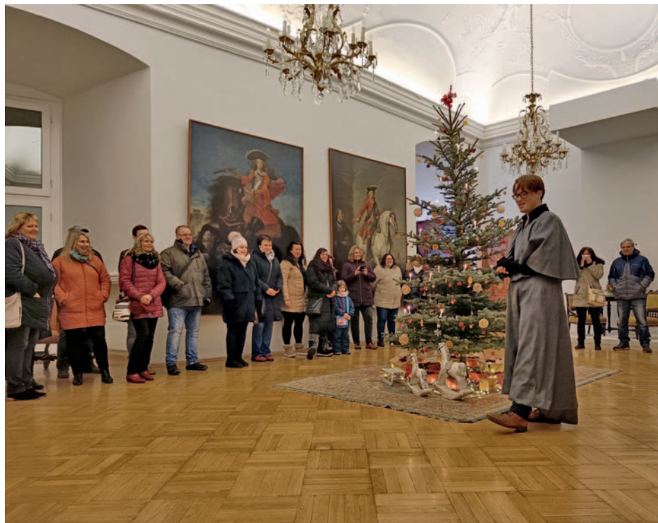
Poslední program roku 2022 – Advent na zámku – mikulovskou veřejnost rozhodně nezklamal.