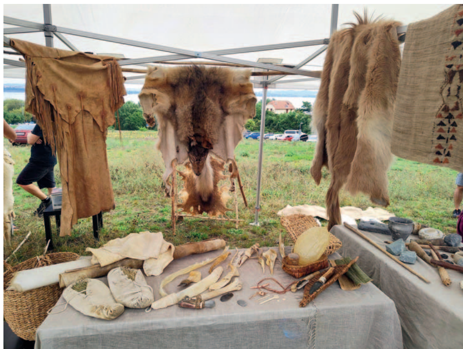
Workshop Lovecká osada se v archeoparku konal již pošesté. Jeho hlavní náplní byl kámen a jeho zpracování a využití k výrobě zbraní.