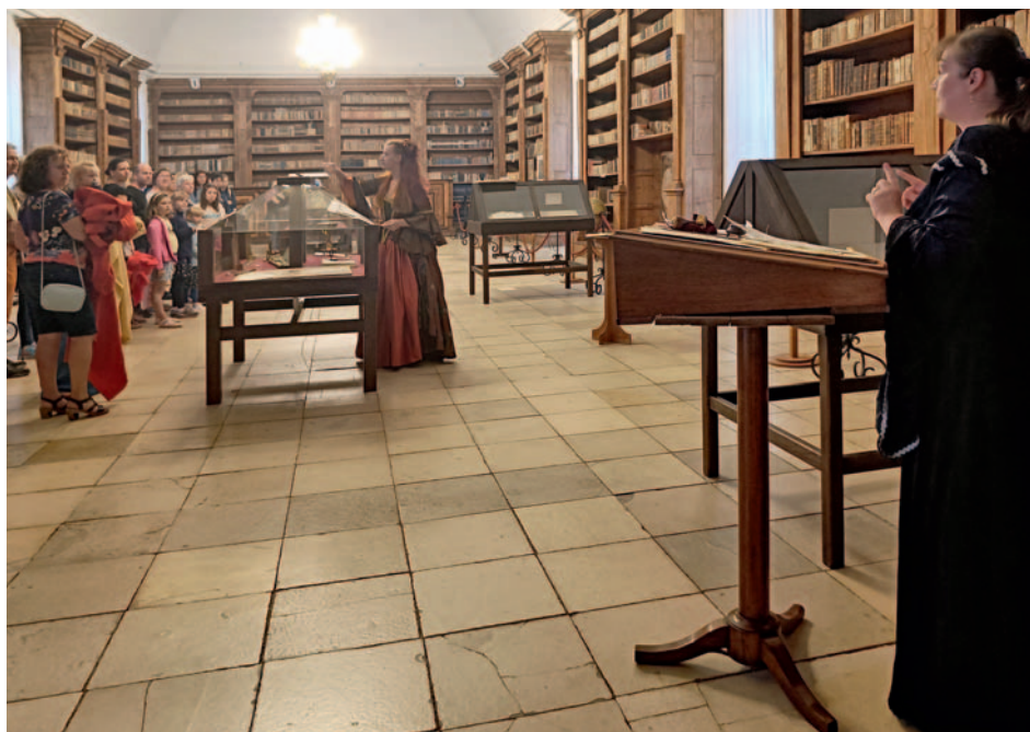
Noční prohlídky se již po řadu let staly součástí letní nabídky programů mikulovského muzea. Postavy z historie zdejšího panství provázejí návštěvníky zámeckými prostranstvími i svými vlastními příběhy.