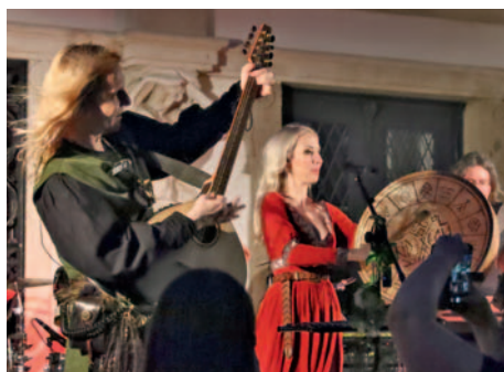
Skupina Deloraine – a finále Muzejní noci

skla a velké malované trojdílné vázy. Pokračovala konzervace pamětního listu k prvnímu svatému přijímání z Brodu nad Dyjí, započatá v předchozím roce. Proběhla konzervace mosazného svícnu, dvoudílné máselnice, dřevěné cedule informující o výsadbě pamětního stromu a olověné uliční cedule z Mikulova. Započata byla konzervace velkého kovářského měchu. Z podsbírký Filmy, pohlednice a fotografie byla konzervována jedna adjustovaná fotografie. Postup všech konzervačních prací byl řádně dokumentován písemně i fotograficky.