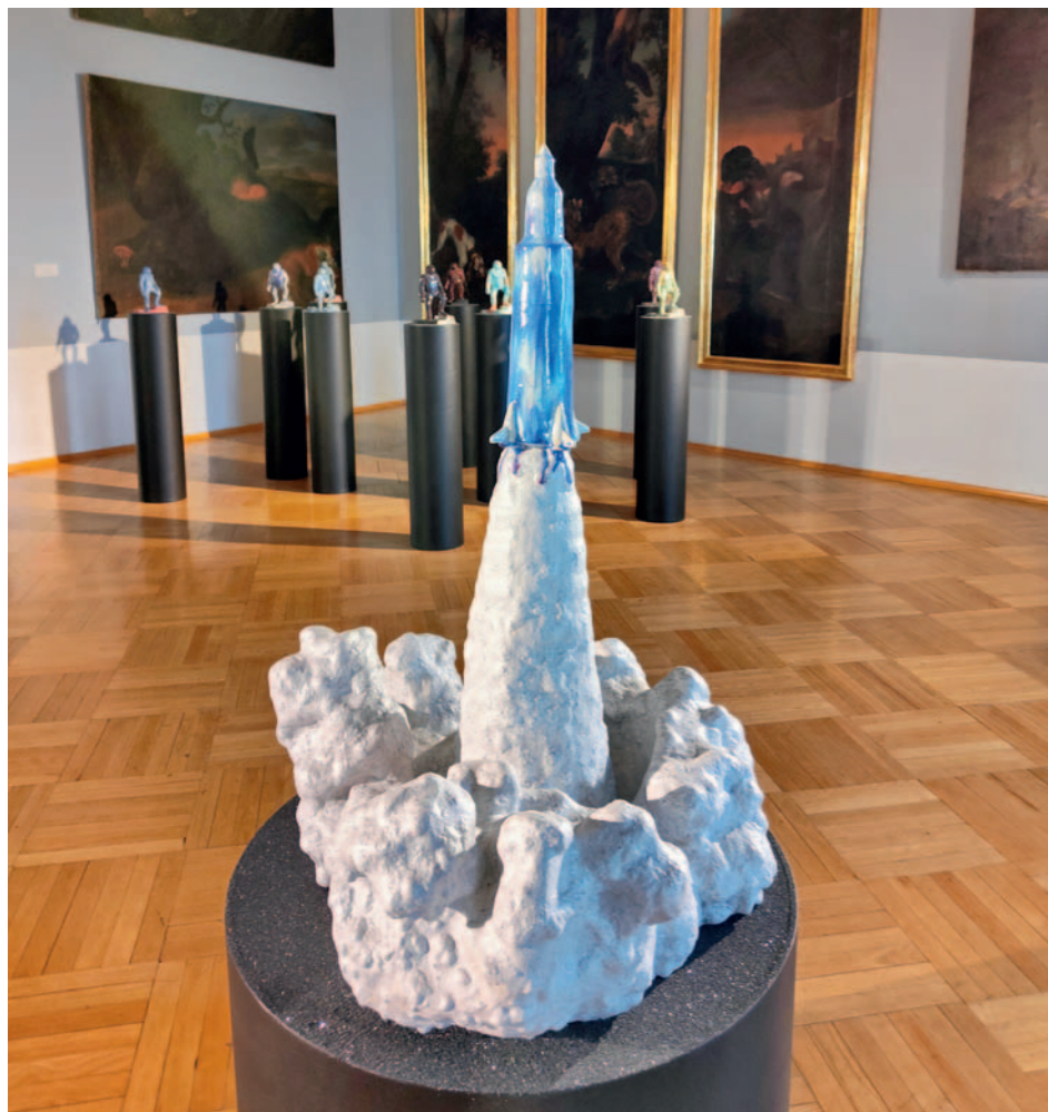
Křehký Mikulov a Sněhová váza nepřehlédnutelného designéra Maxima Velčovského

Výstava, umístěná v prostorách zámečkové knihovny, je postavená především na renesančních a barokních vědeckých přístrojích matematického kabinetu mikulovského piaristického gymnázia, používaných v astronomii, geografii a fyzice, jejichž ucelená kolekce je jedinečná způsobem vzniku, motivovaným potřebami školní výuky.