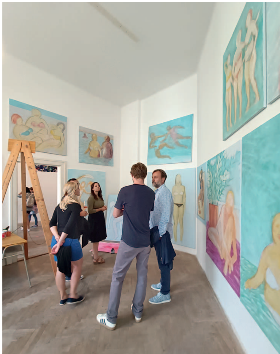
Z vernisáže 29. ročníku Mikulovského výtvarného symposia Dílna

Stejně jako v předchozích letech byly v červenci a srpnu do muzejního programu zařazeny noční prohlídky. Každou středu ve čtyřech prohlídkových časech vcházeli návštěvníci