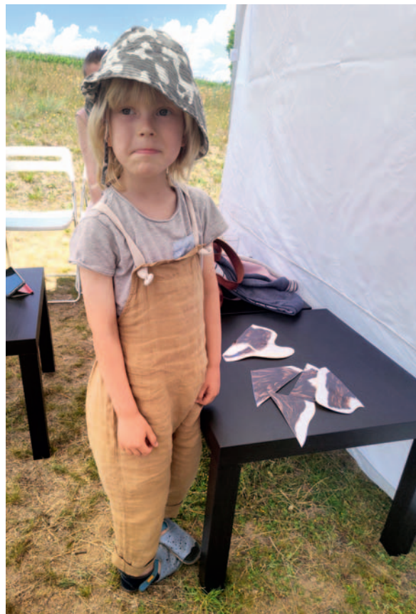
Den dětí v Archeoparku Pavlov – Mami, ten mamut je moc těžký!