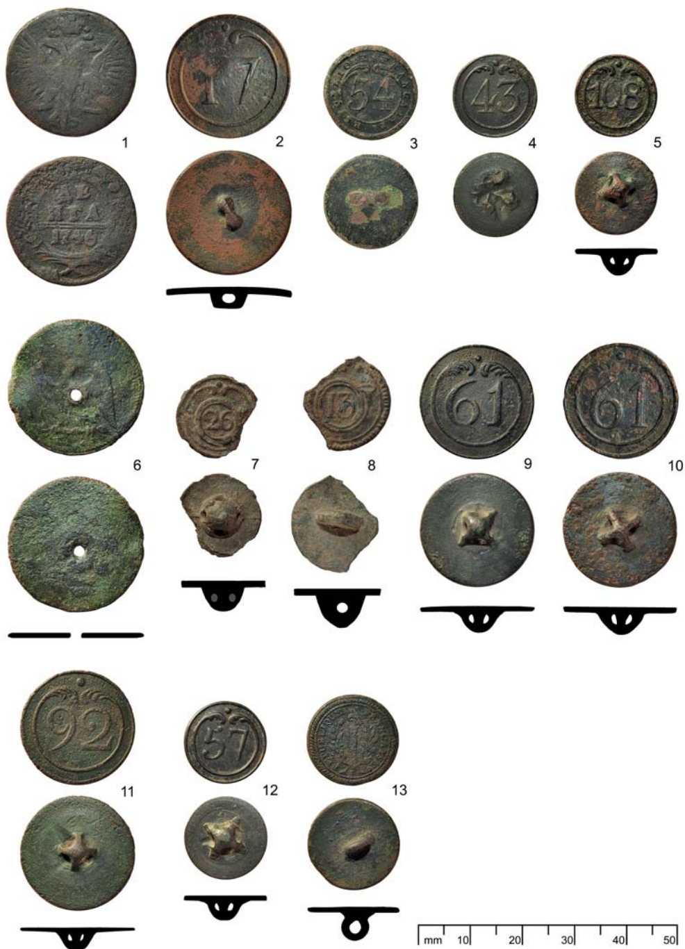
Nálezy francouzských knoflíků a ruské mince na Mikulovsku: Mikulov (1-5), Mušov (6-7), Pasohlávky (8), Břeží (9), Jevišovka (10), Hrušovany nad Jevišovkou (11), Mikulovsko, bližšie nelokalizováno (12-13)