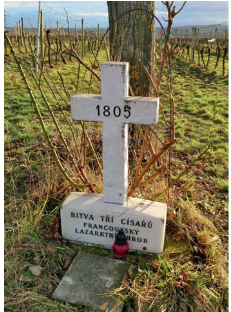
Kříž v Mikulově, při cestě k vinohradům mezi ulicemi Vídeňskou a Valtickou, v místě hrobu francouzských vojáků zemřelých v mikulovském lazaretě v roce 1805 po bitvě u Slavkova

V souvislosti s touto válkou pobývali na našem území delší čas opět francouzští vojáci. Pro raněné byl zřízen lazaret na mikulovském zámku. Po bitvě u Znojma zůstal III. armádní sbor maršála Davouta, čítající 30 tisíc vojáků, na Moravě další tři měsíce. Mezi Drnholcem a Brodem nad Dyjí na kopci zvaném Layerberg (dnes Liščí vrch) byl zbudován jeden ze čtyř táborů francouzské armády. Uzavřením Schönbrunnského míru 14. října 1809 byla uznána porážka Rakouského císařství a francouzští vojáci mohli odtáhnout z Moravy. Tábor u Drnholce byl zrušen 11. listopadu 1809. 7