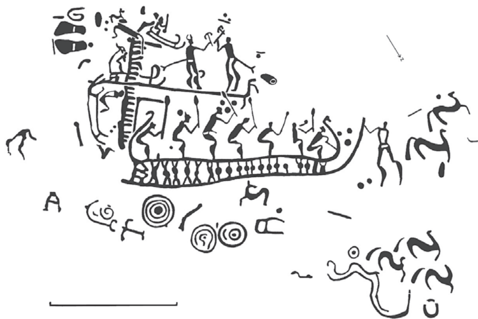
Obrazy ze skalních rytin ve švédském Bohuslänu zachycují výjevy z života lidí doby bronzové. (podle GOLDHAHN – LING 2013)

Neopomenutelným fenoménem doby bronzové je ukládání bronzových depotů do země. Nacházejí se volně v krajině, často se však koncentrují na hradištích či v blízkosti již zmiňovaných výrazných krajinných prvků. I když některé depoty mohly být pozůstatky