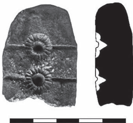
Takzvaný chlebový idol nalezený při povrchovém sběru na katastru Klentnice v poloze Za hřbitovem

mentarizovaného střepevého materiálu získaného povrchovými sběry. Výzkum, který by dataci valu jednoznačně prokázal, však zatím proveden nebyl.