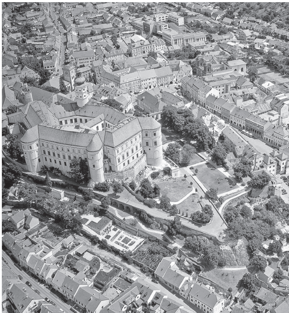
Zámek a jeho zahrada na terasách