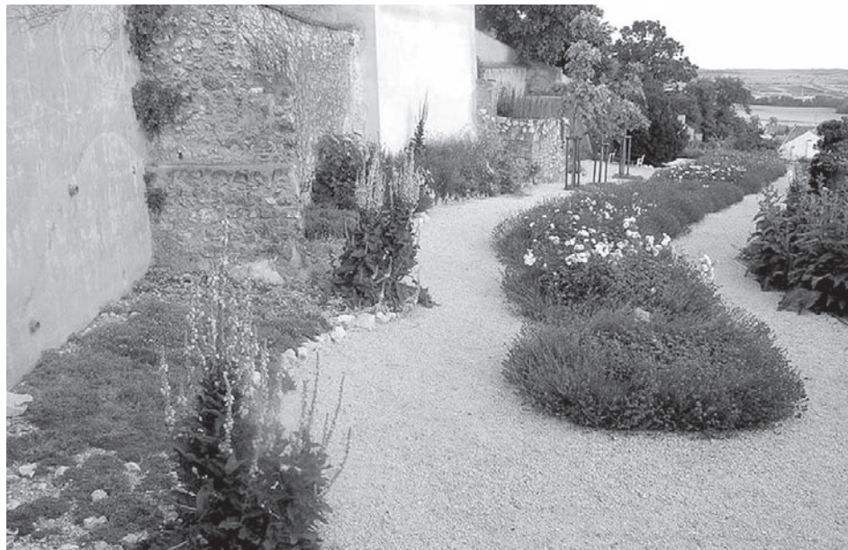
Botanická a růžová zahrada s vazbou na krajinu

Cílem tohoto příspěvku je podat přehled o botanické skladbě zdejší zámecké zahrady a poskytnout návštěvníkům víceméně úplný seznam jednotlivých druhů rostlin včetně jejich umístění v záhonech, a zhodnotit tak využití botanické expozice jak pro turisty, tak i žáky a studenty okolních škol. Tato pomůcka pro snadnější orientaci při vyhledávání a poznávání jednotlivých druhů bylin a dřevin bude současně zpracována formou informačních panelů umístěných v botanické a růžové zahradě a při vstupech do zámeckého areálu.