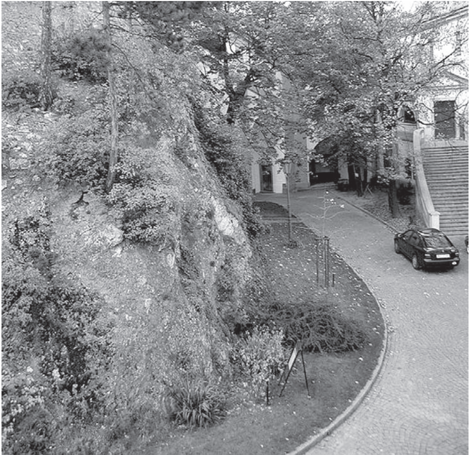
Skalní vápencový step a teplomilný květnatý trávník na druhém zámeckém nádvoří