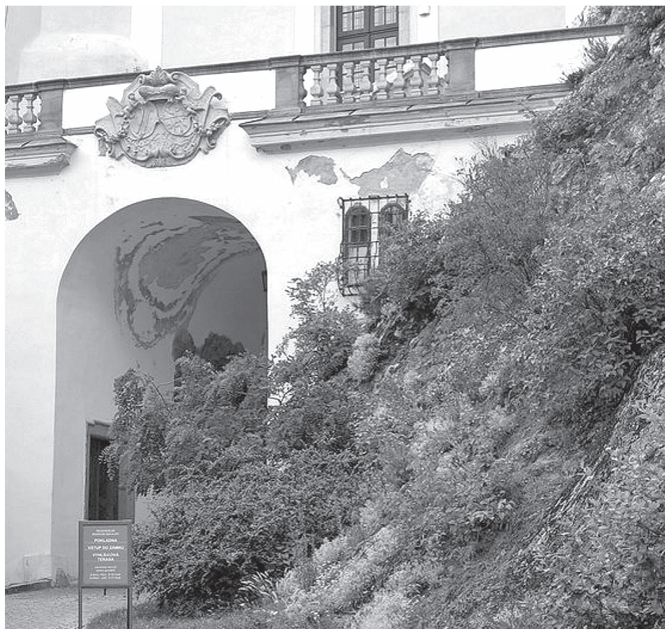
Skalní vápencová step pod severní terasou