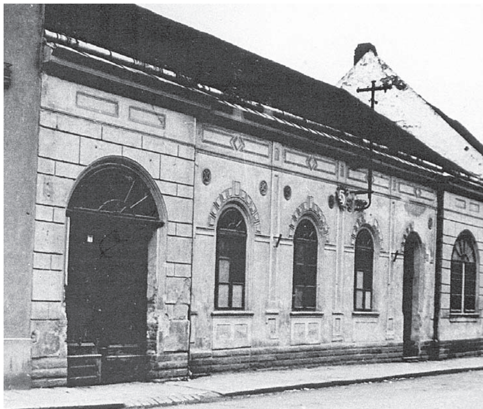
Hustopečská synagoga byla za okupace přeměněna na dům Technické nouzové pomoci (TN-Haus)

je zpět: „Koně nebyli starší 10 let. Dnešní cena činí asi 3 000,- RM. Protože Osídlovací společnost dosud nedostala náhradní koně, žádá o 2 náhradní koně z Protektorátu Čechy a Morava!” 43