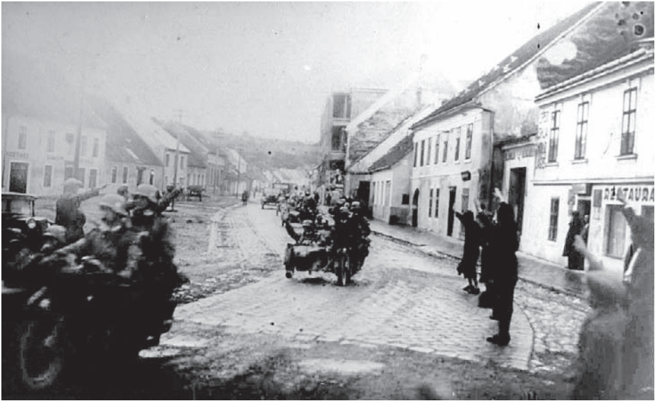
Příjezd erfurtské rychlé divize 8. října 1938 doprovázelo obrovské nadšení většiny německého obyvatelstva