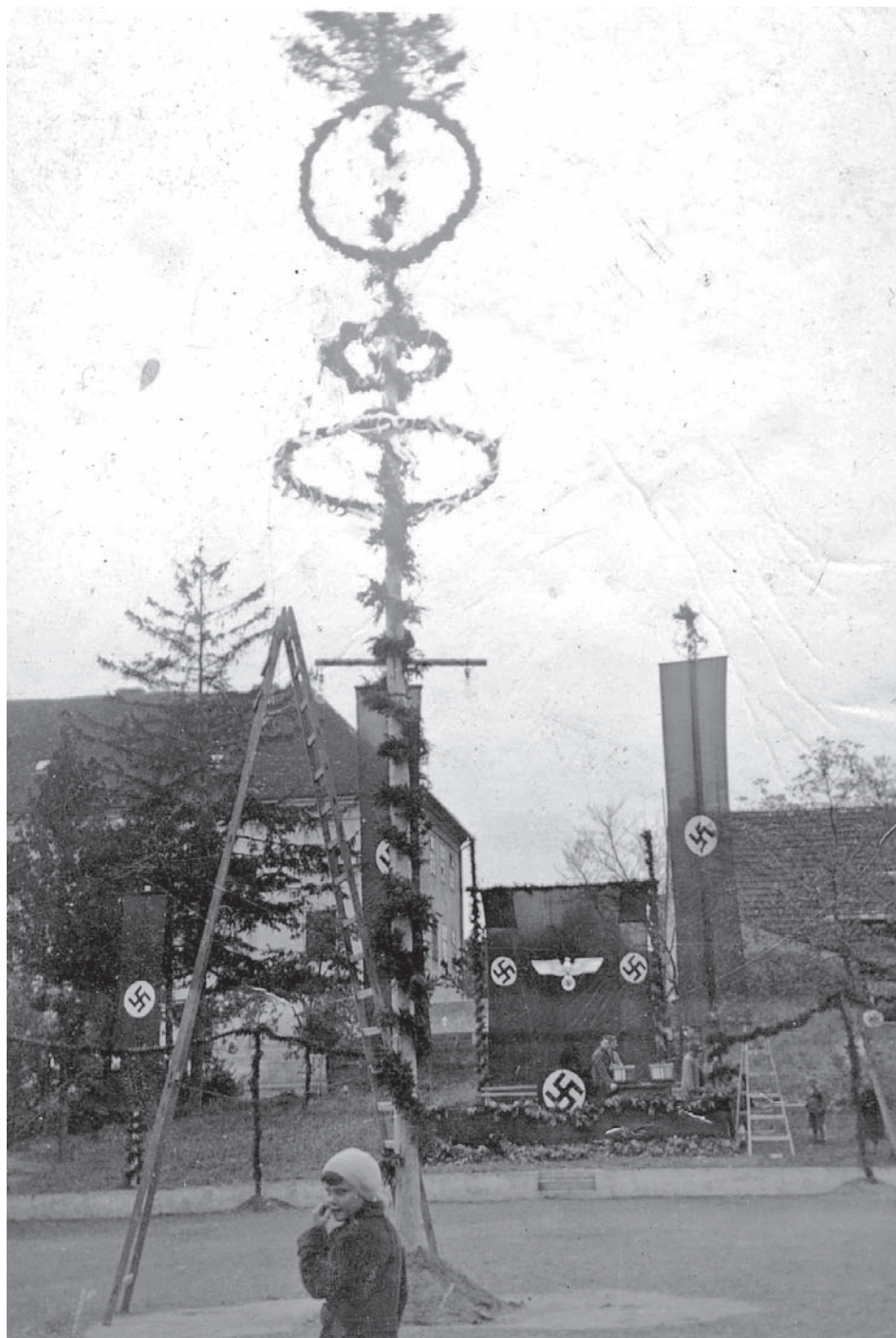
Německá máj vyzdobená na 1. května 1938 nacistickými vlajkami