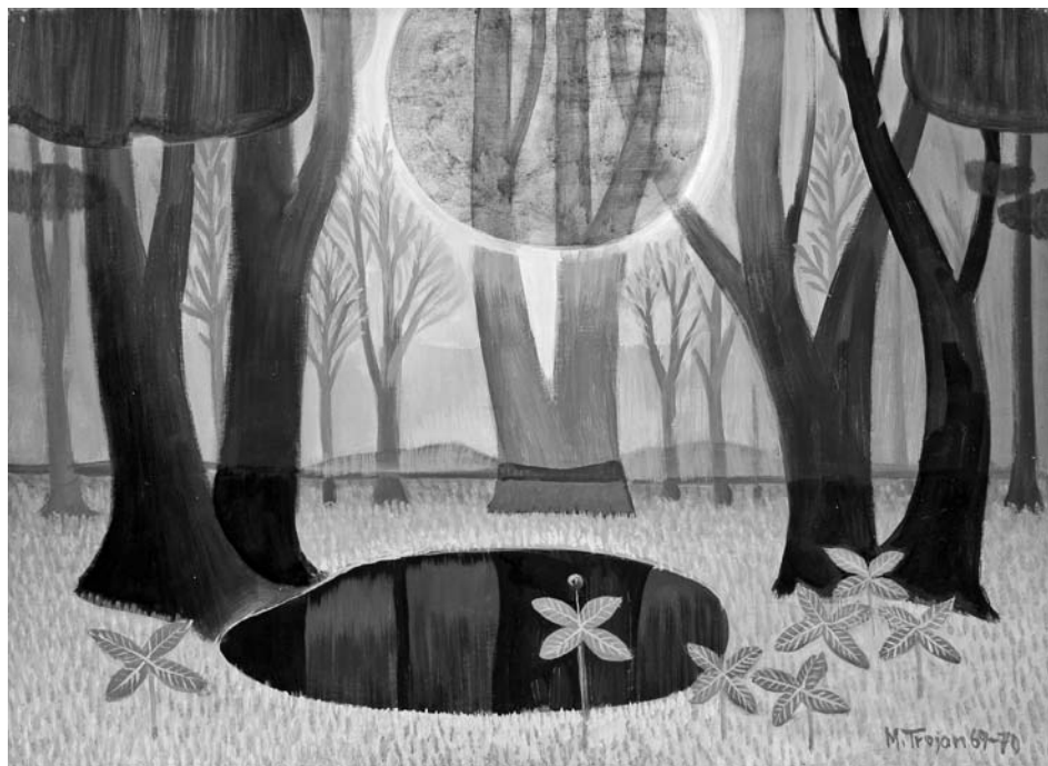
Jezírko vraniho oka, 1969–1970, vaječná tempera, lepenka, 50×70 cm, signováno vpravo dole – M. Trojan 69–70.