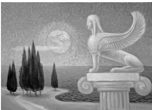
Velká Sfinx z Naxu, 1972, vaječná tempera, karton, 50×70 cm, signováno vpravo dole – M. Trojan.

Trojan bloudil po kopcích u Pouzdřan, hledal krásné kameny, ty mu pak přátelé přiváželi na dvorek a stavěli s ním dílo, které už bohužel zaniklo. Ve dne vítal své hosty v zahradě, večery patřily jenom jemu a světu, jenž si tu vytvořil. Když vyšel měsíc, zjevila se bizarní krajina, jedním pohledem nepřehlédnutelná, s kouty plnými příslibů tajemství přírody, jak ji viděl on a pro sebe kreslil a maloval.