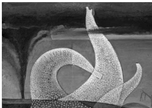
Touha po Slunci, 1963, vaječná tempera, lepenka, 37,5×27 cm, nesignováno.

Výtvarní teoretikové se v katalogových textech shodovali v nemožnosti zařazení Matěje Trojana do dobových trendů a stylů. Od dobové produkce se odlišoval nejen původností inspirace, ale i pronikavostí výtvarného vidění, „díky němuž s přímočarou samozřejmostí spojuje realitu se snem a uvolněnou fantazií, aby dosáhl nečekaných setkání skutečného