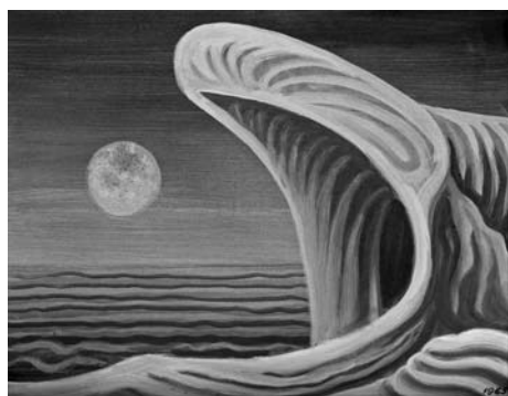
Devátá vlna, 1965, vaječná tempera, karton, 34×43 cm, signováno vlevo dole – M. Trojan, vpravo dole – 1965.

s nadskutečným, spojil rousseauovsky naivní pohled s kultivovanou malířskou formou.“ (Jiří Hlušíčka k výstavě z roku 1975 v Havlíčkově Brodě).