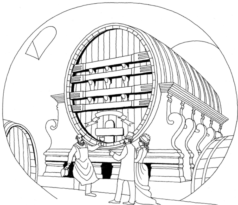
Velký ludwigsburský sud – kresba dle rytiny z roku 1880. (kresba Marta Šiprová)

Původní záměr naplnit sud rýnským vínem ročníku 1724 nakonec padl, neboť Hölbe se obával, že toto víno je „příliš silné a nedokvašené, mohlo by lehce začít šumět, a sud tak poškodit“ (Weber, 1961). Proto bylo do sudu v roce 1725 vloženo zemské víno míšeňských pěstitelů.