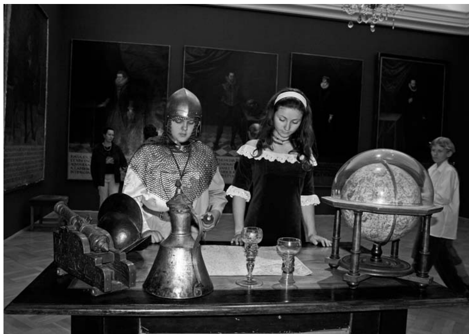
Noc v muzeu si užívali návštěvníci i účinkující z Divadelního spolku Mikulov.