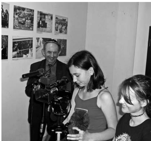
Studentky mikulovského gymnázia při natáčení rozhovoru s židovskými návštěvníky synagogy na společné akci pražského Židovského muzea a místního muzea.