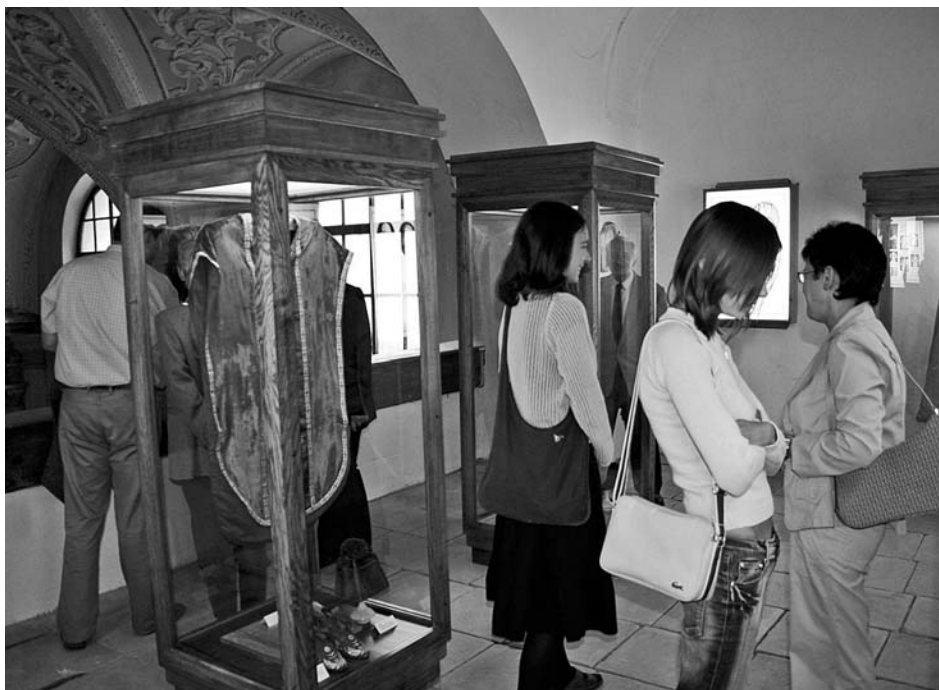
Expozice Verbo et exemplo na panské oratoři kostela sv. Václava je společným dílem Spolku přátel Mikulova a Regionálního muzea v Mikulově.