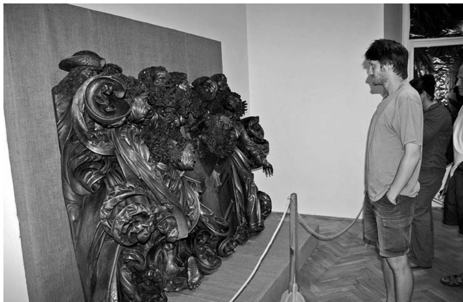
Z výstavy Příběh Světelského oltáře.

V roce 2006 bylo muzeum spolupředatelem již XXIX. Mikulovského sympozia archivářů a historiků, které je tradiční akcí Státního okresního archivu Břeclav se sídlem v Mikulově.