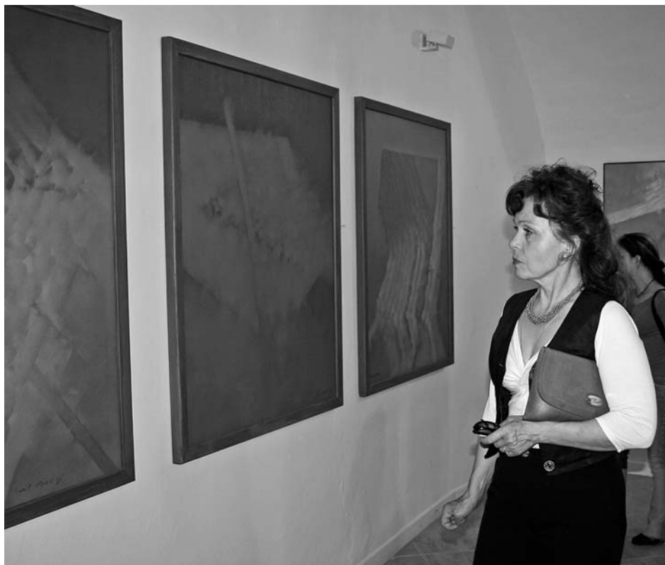
Výstava obrazů Cyrila Urbana Malířův zápas s andělem.