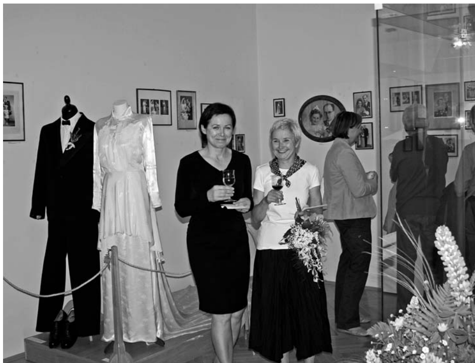
Vernisáž výstavy Květiny bílé po cestě.