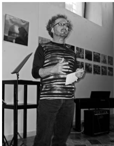
Vzácná návštěva v synagoze – fotograf Brian Henderl přijel z Izraele osobně zahájit svou výstavu Balagan (Změť). (foto Milan Karásek)