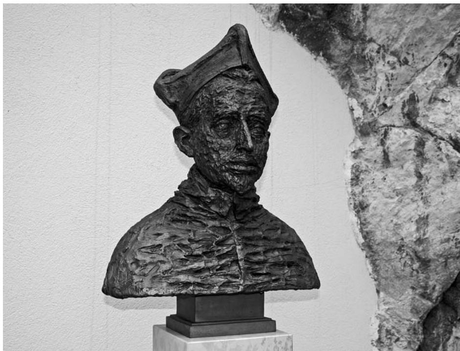
Busta kardinála Dietrichsteina instalovaná na jižním nádvoří mikulovského zámku.

Hendler neobyčejně dramatický soubor fotografií zachycují situace z běžného života v Izraeli, jako jsou oslavy svátků, životní styl ortodoxních Židů, politické události, také však izraelsko-palestinský konflikt či stahování židovských osadníků z pásma Gazy, za něž byl v roce 2005 oceněn americkou cenou Simona Roskowera. Soubor fotografií umístěných v synagoze byl zhotoven z prostředků Nadace židovského muzea v Praze a stal se majetkem Regionálního muzea.