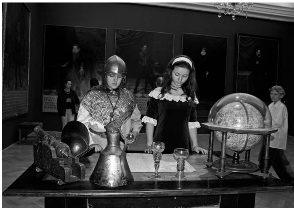
Noc v muzeu si užívali návštěvníci i účinkující z Divadelního spolku Mikulov.