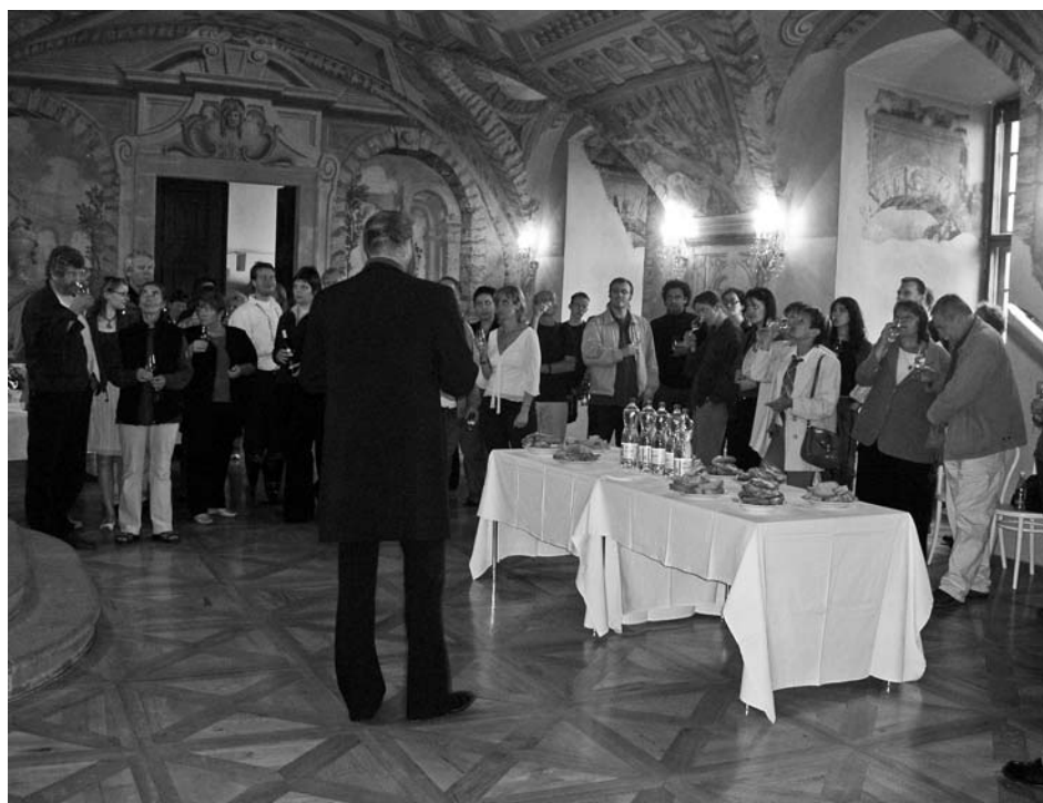
Netradiční košt košer vín rozhodně zaujal.

18. století, pohárek na kiduš z přelomu 16. a 17. století, který podle tradice používal rabi Löw aj.). Pozoruhodná byla také výstava Balagan/Změť fotografa Briana Henderla, který ji z Izraele přijel osobně zahájit. Při svém povolání zpravodajského fotografa vytvořil