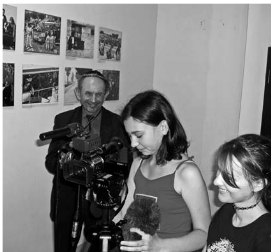
Studentky mikulovského gymnázia při natáčení rozhovoru s židovskými návštěvníky synagogy na společné akci pražského Židovského muzea a místního muzea.

18. století, pohárek na kiduš z přelomu 16. a 17. století, který podle tradice používal rabi Löw aj.). Pozoruhodná byla také výstava Balagan/Změť fotografa Briana Henderla, který ji z Izraele přijel osobně zahájit. Při svém povolání zpravodajského fotografa vytvořil