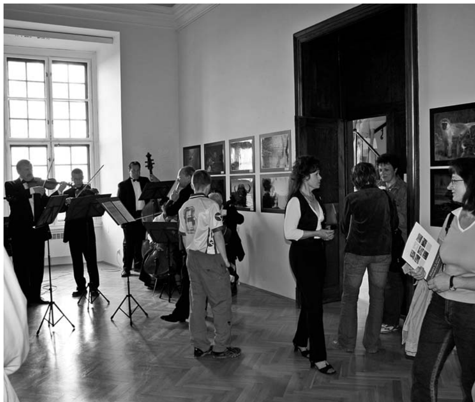
Videňské valčíky v podání komorního orchestru Collegium Magistrorum v předvečer muzejní noci.