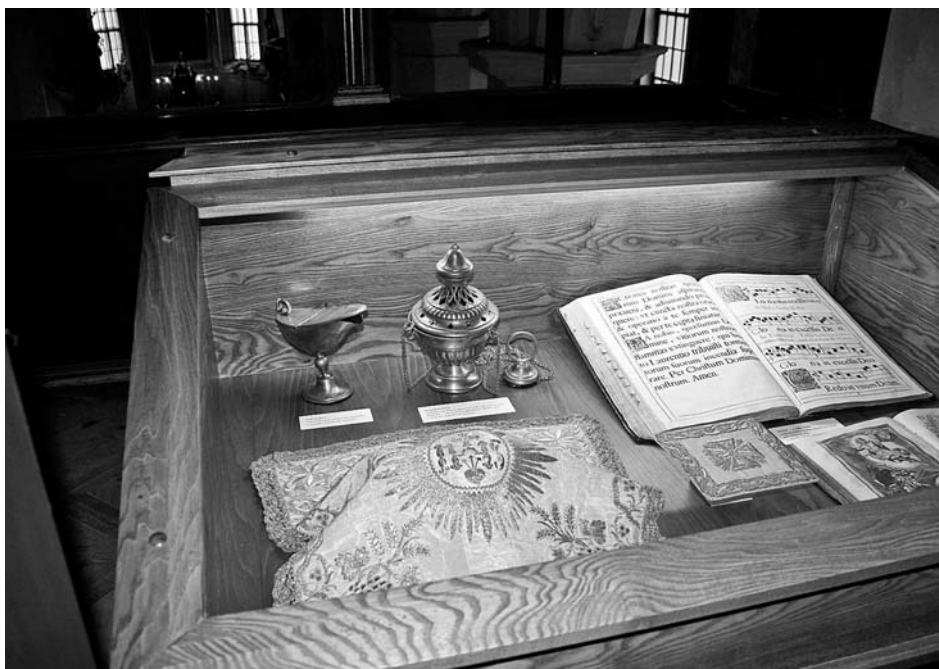
Vitrína s exponáty v expozici Verbo et exemplo.