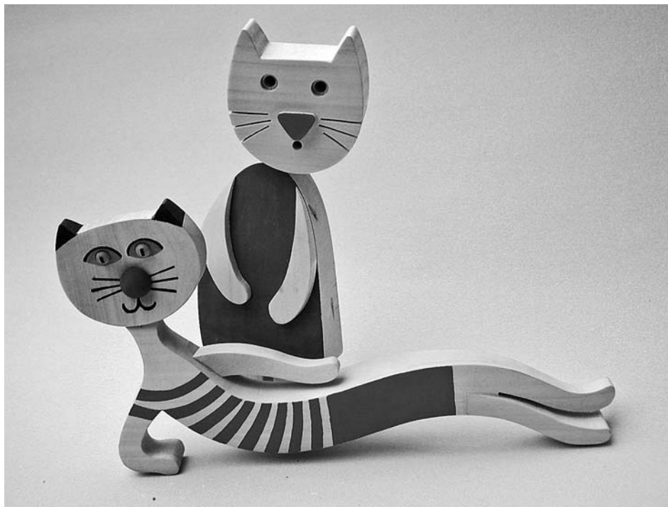
Kočkohrátky přilákaly děti do muzea i v zimních měsících.