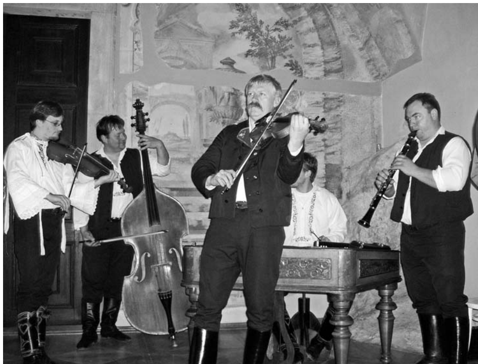
K řadě muzejních akcí neodmyslitelně patří cimbálová muzika.

události znamená pro muzeum kromě účasti na pravidelném setkávání historiků obou mikulovských ústavů s historiky českých zemí i se zahraničními vědci také významnou prezentaci práce muzea směrem k odborné veřejnosti.