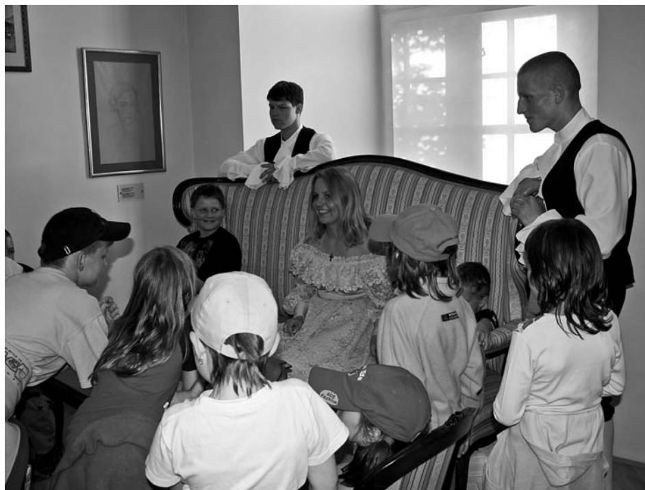
Muzejní svátek přivedl na zámek i tu nejmladší generaci, na kterou bylo v programu pamatováno.