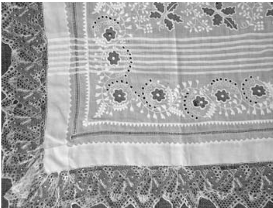
Detail výšivky dívčího fěrtochu ke slavnostnímu kroji „na vyslečení“. Bílá výšivka na batistu, paličkované „vláčkové“ čipky. Poštorná, 1890–1900.

pro všední či sváteční nošení. Přibližně do první světové války se šily rukávce i tacle z lněného plátna (ještě dříve i z konopného) a byly každodenní součástí ženského kroje. Zavazovaly se u krku na dvě smyčky a zbylé šňůrky visely až po pás. Přímo ke košilce byl přišit i „obojek“ obdélníkového či čtvercového (typické pro Poštornou na přelomu 19. a 20. století) tvaru z bílého jemnějšího plátna, ozdobeného zpravidla jen zoubkovaným ukončením – „ocanglováním“. Rukávce se oblékaly na spodní košilku, následný byl plátěný lajbl. Ženy i dívky v nich vykonávaly po celý den všechny domácí a polní práce, čemuž odpovídaly i kratší rukávy a větší klín v podpaží. Při chladném počasí se přes ně oblékala kacobaja, přes kterou se v tomto případě přehodil obojek. Tomuto popisu zhruba odpovídají i nejstarší rukávce z muzejní sbírky, pocházející z Poštorné z let 1890–1900. Nemají tacle a batistový obojek je ukončen ručně háčkovánými krajkami – „čipkami“, což určuje jejich nošení při polosvátečních příležitostech.