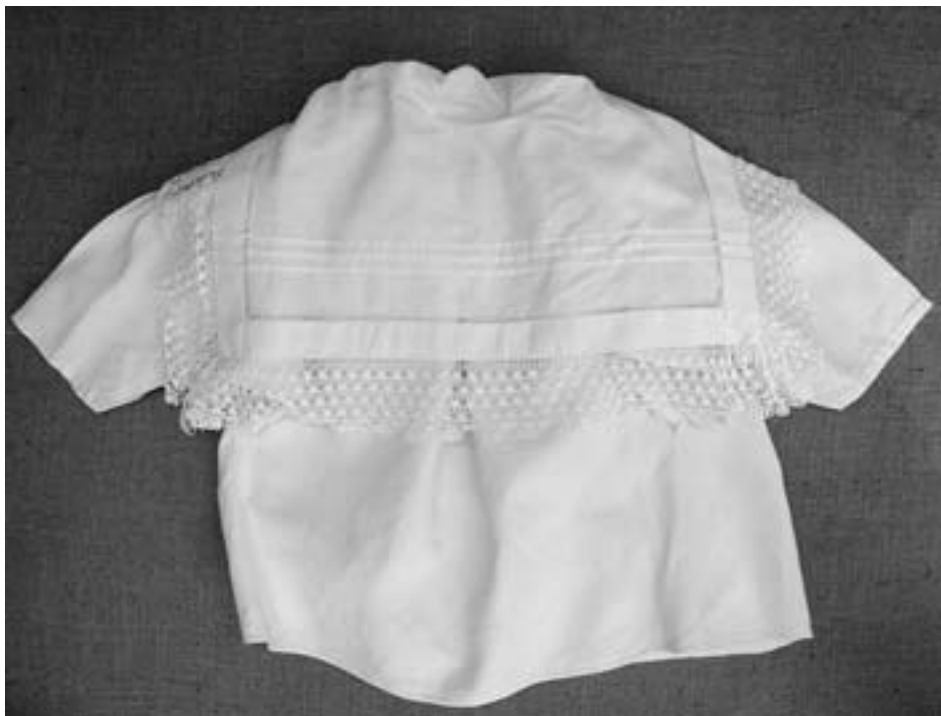
Polosváteční lněné rukávce s obojkem, ručně háčkové čipky. Poštorná, kolem 1900.

let 1890 až konec třicátých let 20. století. Šátky mají více či méně širokou formu tištěného dekoru s rostlinným ornamentem (oblíbený byl zejména motiv pivoňek) a nosily se vždy k vlňákům, „šatům“ do kostela, na pohřby a při svátečních příležitostech. Na fotografiích je mají mladé dívky uvázané k canglovým i hedvábným zástěrám. V meziválečných letech se začínají objevovat i bílé vlněné šátky se vzorem, po roce 1945 pak zcela převažují černé nebo bílé tesilové šátky, zdobené již malbou na textil, a hojně se nosí i šátky z lehkého brokátu v pastelových tónech.