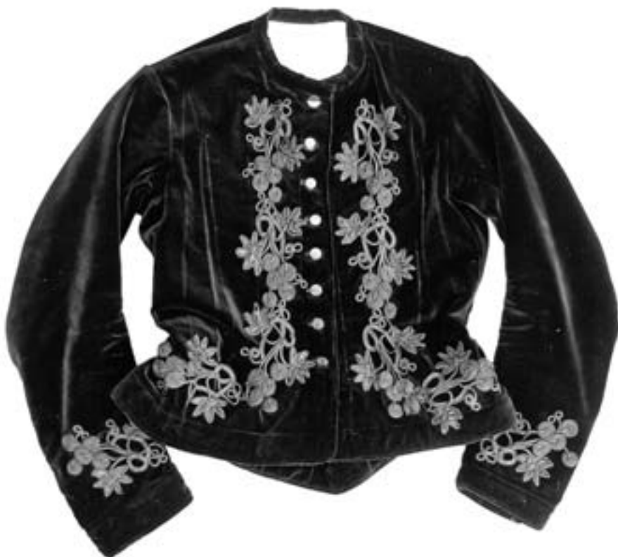
Kacabaja „na pevno“ (kožušek). Samet a látková aplikace. Stará Břeclav, kolem 1890.

Staré původní „libigové“ vlnáky (nazývané podle vídeňského výrobce), které se ještě ve třicátých letech minulého století hojně kupovaly na výročních trzích v Břeclavi i u židovských obchodníků v Hodoníně, musely být po roce 1945 nahrazeny novými, zhotovenými v Uher-ském Hradišti v družstvu Slovač. Vzory pro obnovenou výrobu teplých vlněných vlnáků sbíral dr. Jaroslav Orel ze Slovákckého muzea po celém Podluží, a ačkoliv se podařilo zhruba do-držet původní barvy a vzory, kvalita a síla poválečných výrobků je již o poznání horší.