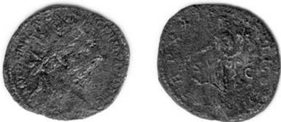
Dupondius Marka Aurelia (161–180 n. l.).