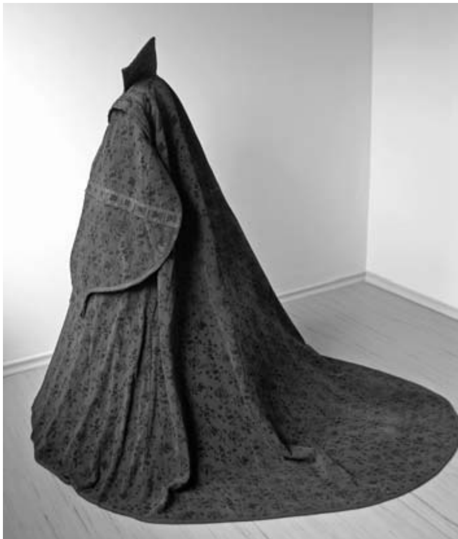
Roucho, pohled zezadu.

Když byla rakev hraběnky Lobkowiczové otevřena, pokrývaly její tělo zbytky lněného rubáše. Její hlava spočívala na sametovém polštáři, pod nímž se nacházel ještě sametový váček vyplněný vlasy. Šat, v němž byla do rakve uložena, tvoří španělská ropa se širokými rukávy a wams (kabátek) úzkého střihu. Oba oděvy mají vysoké stojací límce a každý z nich