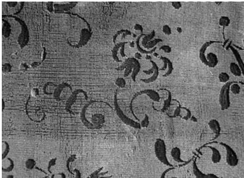
Vzor vyřezaný do hedvábného sametu – detail tkaniny roucha.

Obrubu ropy tvoří dvě různě vzorované vyšívání atlasové šňůrky. Roucho je zčásti podloženo hedvábným taftem, původně mělo na několika místech ještě lněnou podšívku. U pasu v přední levé a pravé části má pět vedle sebe obšitých dírek. Dvěma z nich se protahovala stužka, kterou se přidržovala klopa, ostatní sloužily snad k tomu, aby ropa těsně přiléhala k živůtku pod ní.