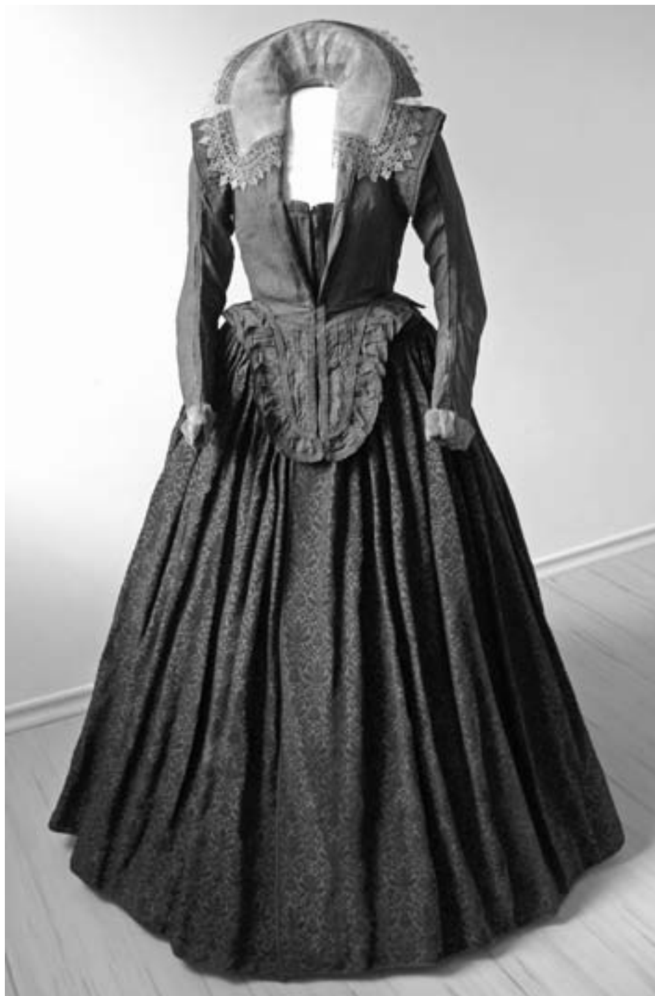
Wams s krajkovým límcem a manžetami a sukně, pohled zepředu.