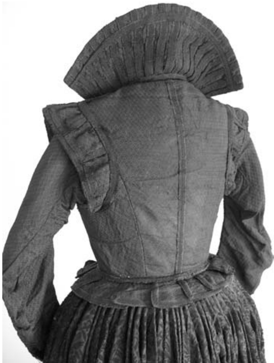
Wams, pohled zezadu.

Čepec, který svým tvarem patřil k typicky českému oděvu, je zhotoven z jemné hedvábné tkaniny a je zdoben vsadkami s motivy z jemné krajky. Lem čepce je zdoben toutéž hedvábnou paličkovanou krajkou, která zdobí i límec.