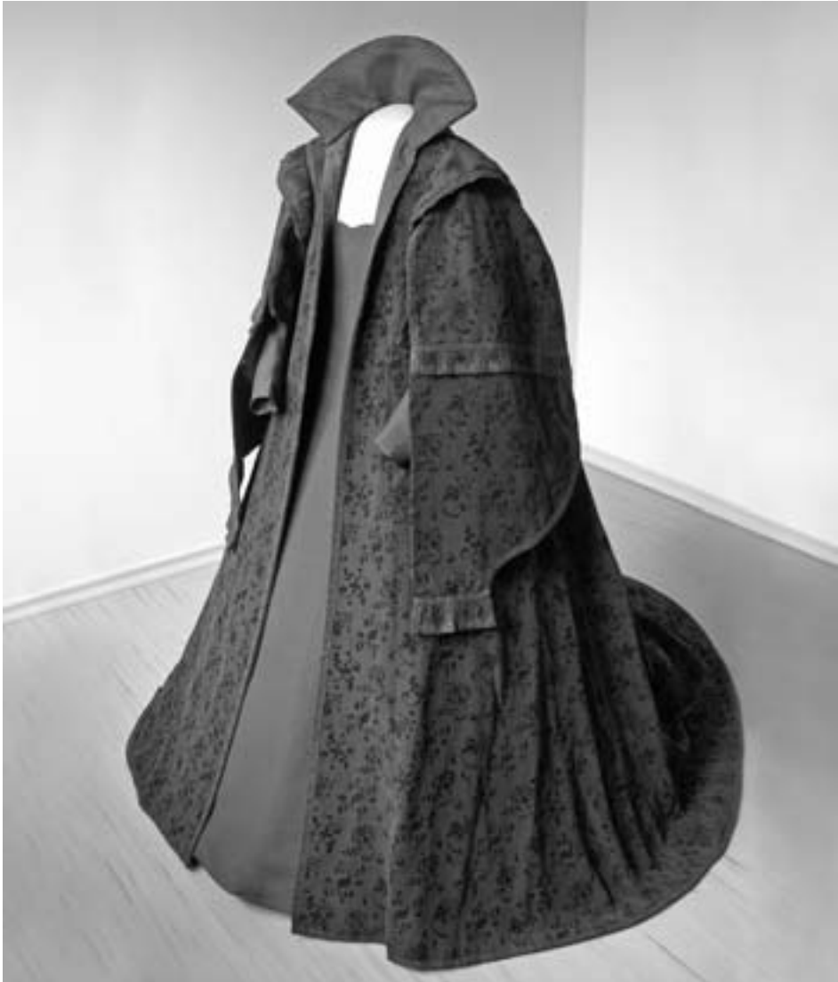
Roucho, pohled zepředu.

Sukně bez skladů je oblečena přes kuželovitou španělskou krinolínu (verdugado). Je zhotovena z drahocenné tkaniny s florálními motivy, pravděpodobně ze zlatožlutého sametu se