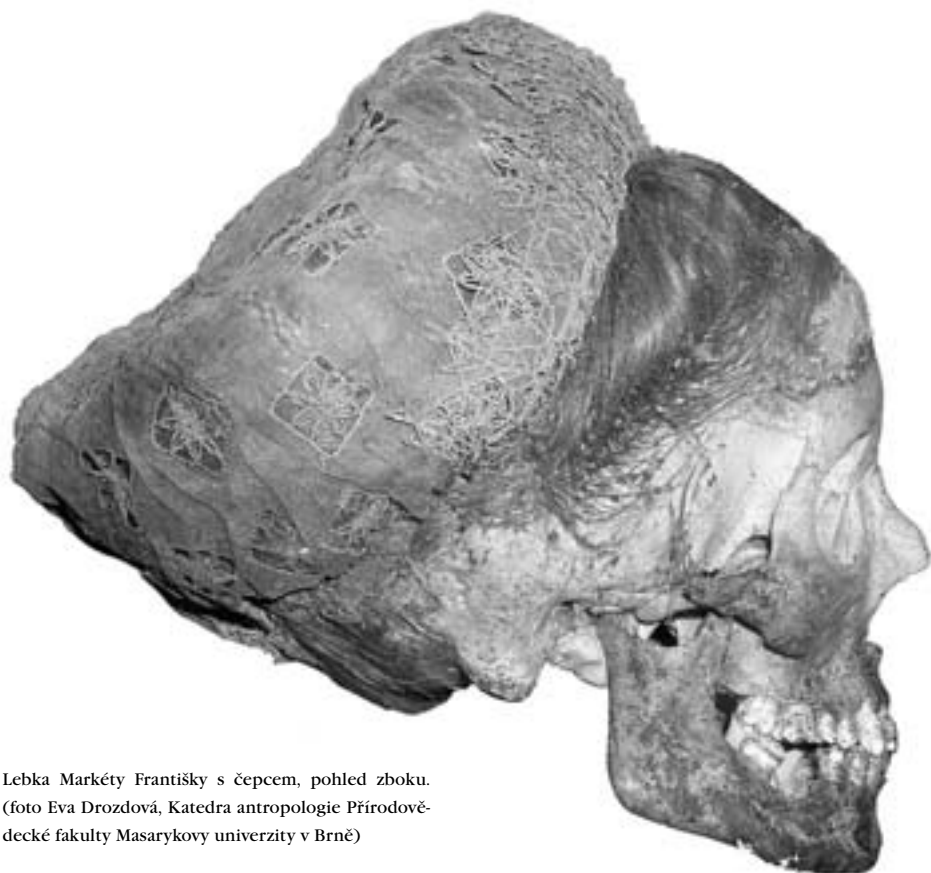
Lebka Markéty Františky s čepcem, pohled z boku.