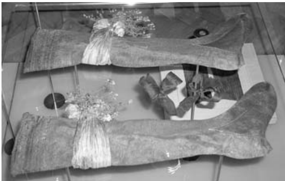
Punčochy, podvazky a mašle z obuvi.