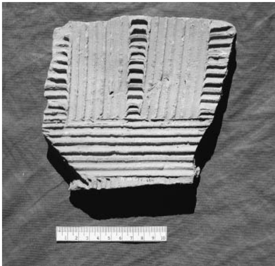
Část stavební keramiky. Inv. č. A/M 698 (z. ev. 684, IV 711, IV 247).

Inv. č.: A/M 686 (z. ev. 665, IV 712, IV 248).