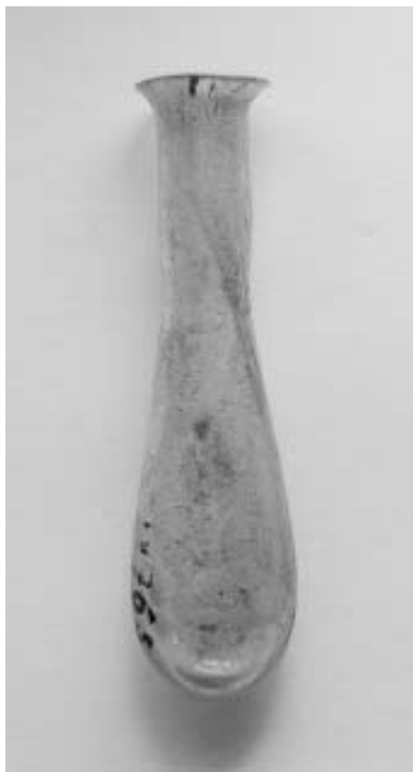
Skleněná nádoba. Inv. č. A/M 691 (z. ev. 676, IV 765).