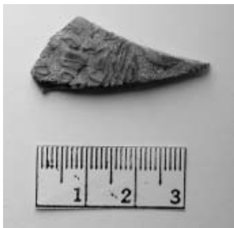
Fragment skla millefiori. Inv. č. A/M 693 (z. ev. 673, IV 8).