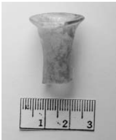
Hrdlo skleněné nádoby. Inv. č. A/M 693 (z. ev. 674).