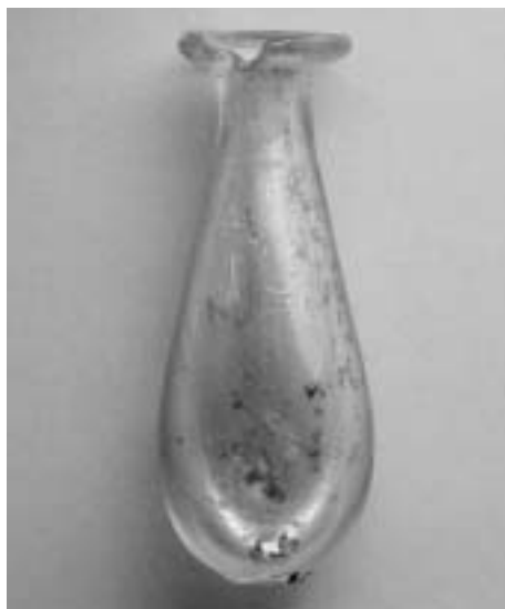
Skleněná nádoba. Inv. č. A/M 691 (z. ev. 676, IV 765).

Problematické je určení třetí nádoby (kat. č. 13), která je sice v katalogu sbírky označena jako římská, ale stav zachování povrchu nádoby a technologické stopy po výrobě naznačují, že jde o novější předmět. Také tvarově nádoba vybočuje z typově podobných římských skel.