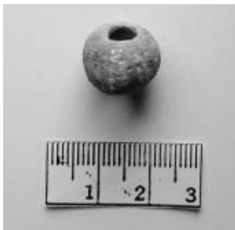
Korál ze skelné pasty. Inv. č. A/M 694 (z. ev. 675, IV 242, IV 769).