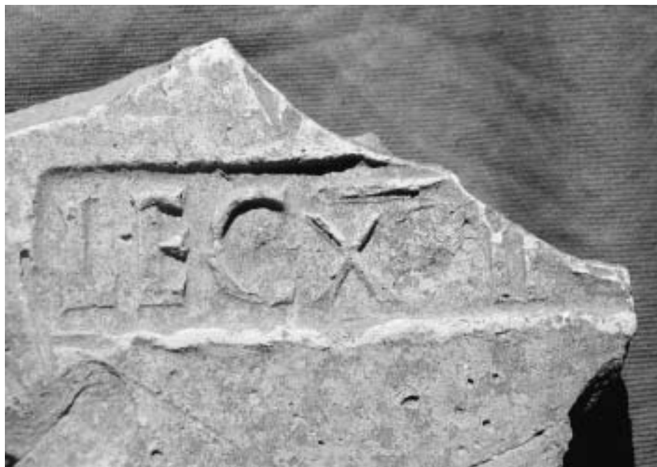
Zlomek cihly s částí kolků XIV. legie. Inv. č. A/M 416 (z. ev. 304, IV 710).

Popis: Fragment střešní tašky – imbrexu – o šířce 2,2 cm. Na vnější straně umístěn špatně čitelný, neúplný kolek LEG... umístěný v obdélném rámečku o výšce 2 cm.