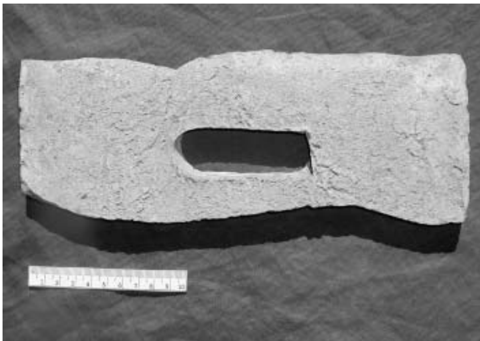
Zlomek tubulu. Inv. č. A/M 686 (z. ev. 665, IV 712, IV 248).