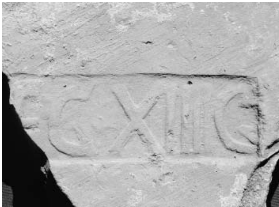
Zlomek cihly s částí kolku XIV. legie. Inv. č. A/M 416 (z. ev. 304, IV 187).

V případě imbrexu 3 nelze vzhledem ke špatnému zachování kolku nalézt bližší analogii, která by umožnila jeho datování.