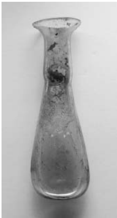
Skleněná nádoba. Inv. č. A/M 691 (z. ev. 671, IV 765).