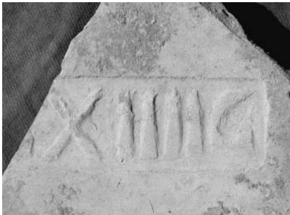
Zlomek cihly s částí kolku XIV. legie. Inv. č. A/M 416 (z. ev. 304, IV 94).