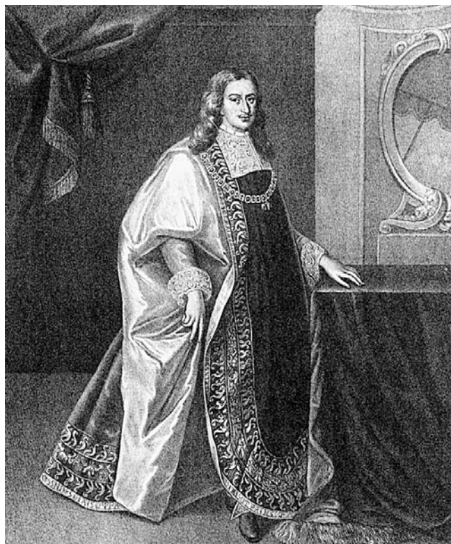
Ferdinand Josef, kníže Dietrichstein (1636–1698)

Pověst o zázracích mikulovské loretánské madony oslovila zbožného císaře Leopolda I. V létě roku 1672 vykonal se svojí ženou Markétou Marií a několika dvořany náboženskou pouť do Mikulova, jistě příjemnou i v tom ohledu, že hostitelem byl jemu a zejména pak císařovně blízký Ferdinand Josef Dietrichstein. Císař