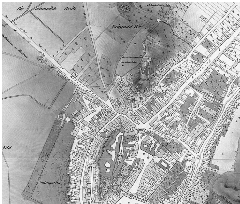
Židovský hřbitov před rozšířením na plánu města Mikulova z roku 1826.

Z dosavadních výsledků dokumentace vyplývá, že tyto náhrobky pocházejí z období mezi koncem 17. století a počátkem 19. století. Je tedy pravděpodobné, že ke stavbě tarasu a překrytí původních hrobů došlo někdy v první polovině 19. století, pravděpodobně před rokem 1826. Na mapě panství z tohoto roku je židovský hřbitov ještě před rozšířením o severozápadní část. Vzhledem k velkému počtu židovského obyvatelstva (v roce 1836 žilo v Mikulově 3520 Židů) lze předpokládat, že se představení obce rozhodli pro toto řešení. Není ale jasné, proč nebyl hřbitov rozšířen o severozápadní část již tehdy a byla zvolena nepochybně komplikovanější varianta překrytí starých hrobů vrstvou zeminy. Možným důvodem, který by vedl k této úpravě, snad mohla být také živelná pohroma, při které sklouzla masa zeminy hřbitova po vápencovém podloží a poškozené hroby bylo nutné zabezpečit. Definitivní odpověď budeme znát až po dokončení celého projektu.