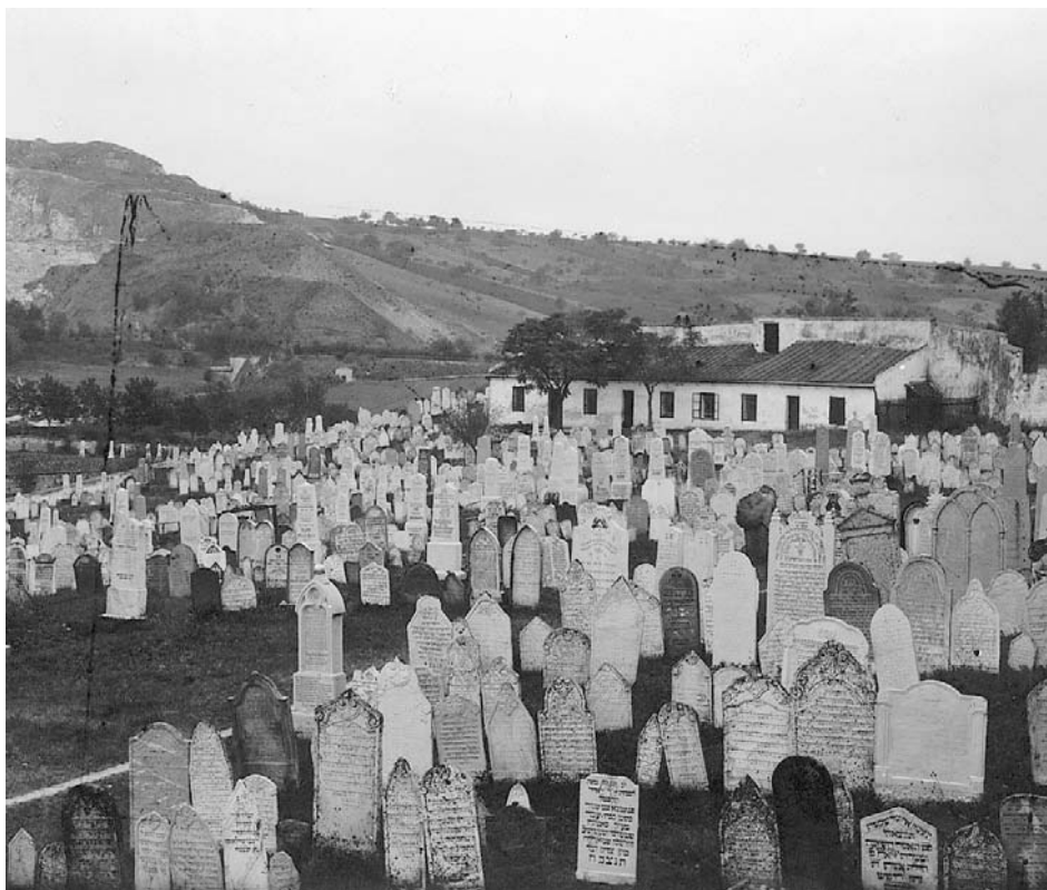
Pohled na židovský hřbitov z počátku 20. století.

vlny – z roku 1648 po Chmelnického povstání v Polsku, v roce 1671 po druhém vyhnání Židů z Dolního Rakouska a Vídně a v roce 1690 z Bělehradu po jeho dobytí císařským vojskem a také příchod haličských uprchlíků v důsledku bojů první světové války v roce 1914 – už bude možné identifikovat snáže, protože náhrobky z tohoto období jsou na hřbitově relativně dobře zastoupeny. Výsledky výzkumu budou velmi cenné také proto, že tyto otázky nebyly zatím v odborné literatuře zpracovány.