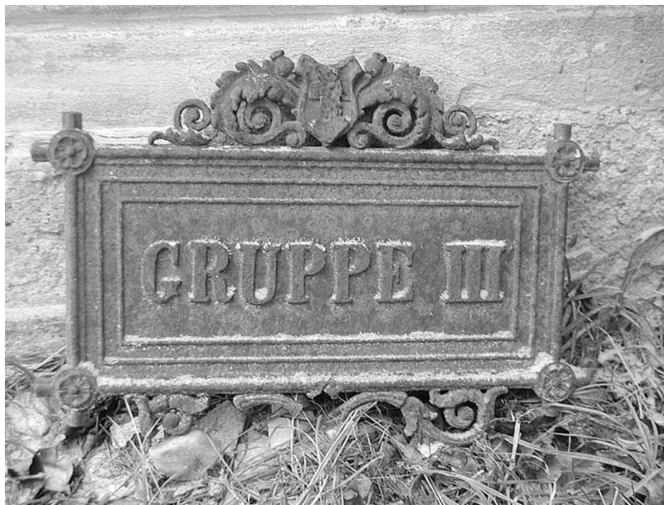
Cedule z někdejšího orientačního systému hřbitova z roku 1898.

Židovský hřbitov v Mikulově má rozlohu 19 180 m 2 , což jej řadí mezi největší předemancipační židovské hřbitovy v České republice. Nejasný je přesný počet všech dochovaných náhrobků 7 (který se navíc krádežemi neustále zmenšuje) a stejně tak zůstává nerozřešena datace nejstaršího čitelného náhrobku.