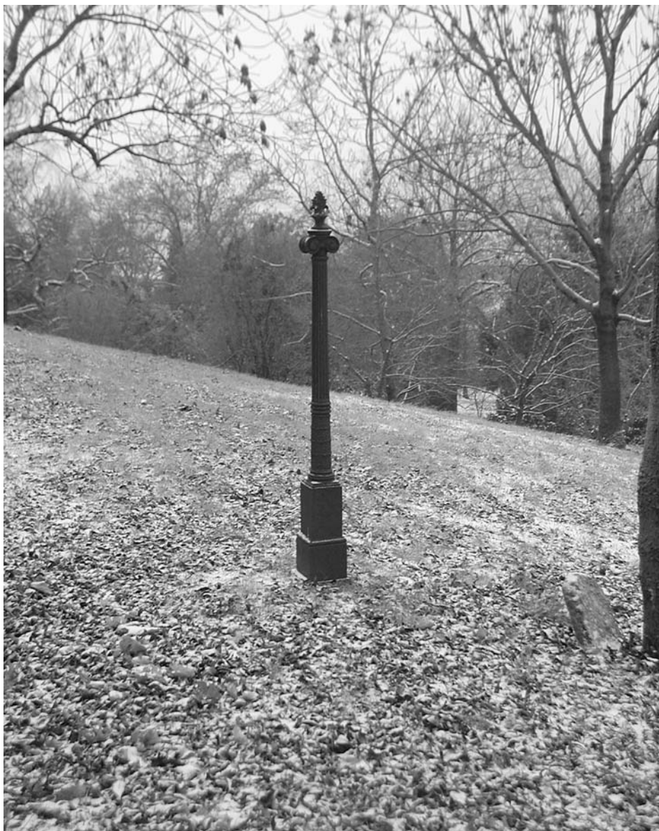
Stojan z původního orientačního systému hřbitova z roku 1898.

Ve stejné době, kdy byla založena Hřbitovní kniha, došlo také podle všeho k rozdělení hřbitova na deset sekcí (skupin), které byly označeny litinovými tabulkami s římskými číslicemi I–X, jež se stejně jako původní plánek nedochovaly. Před začátkem dokumentačních prací bylo třeba kvůli neexistenci plánů výše uvedeného původního rozdělení hřbitovů provizorně rozčlenit na několik vhodných pracovních oblastí, které se řídí dnešním uskupením náhrobků. Největším problémem byla paradoxně delimitace rabínského okrsku, který na své jihozápadní straně volně přechází do střední části hřbitova, odkud do něj zasahují skupiny hrobů významných mikulovských rodin.