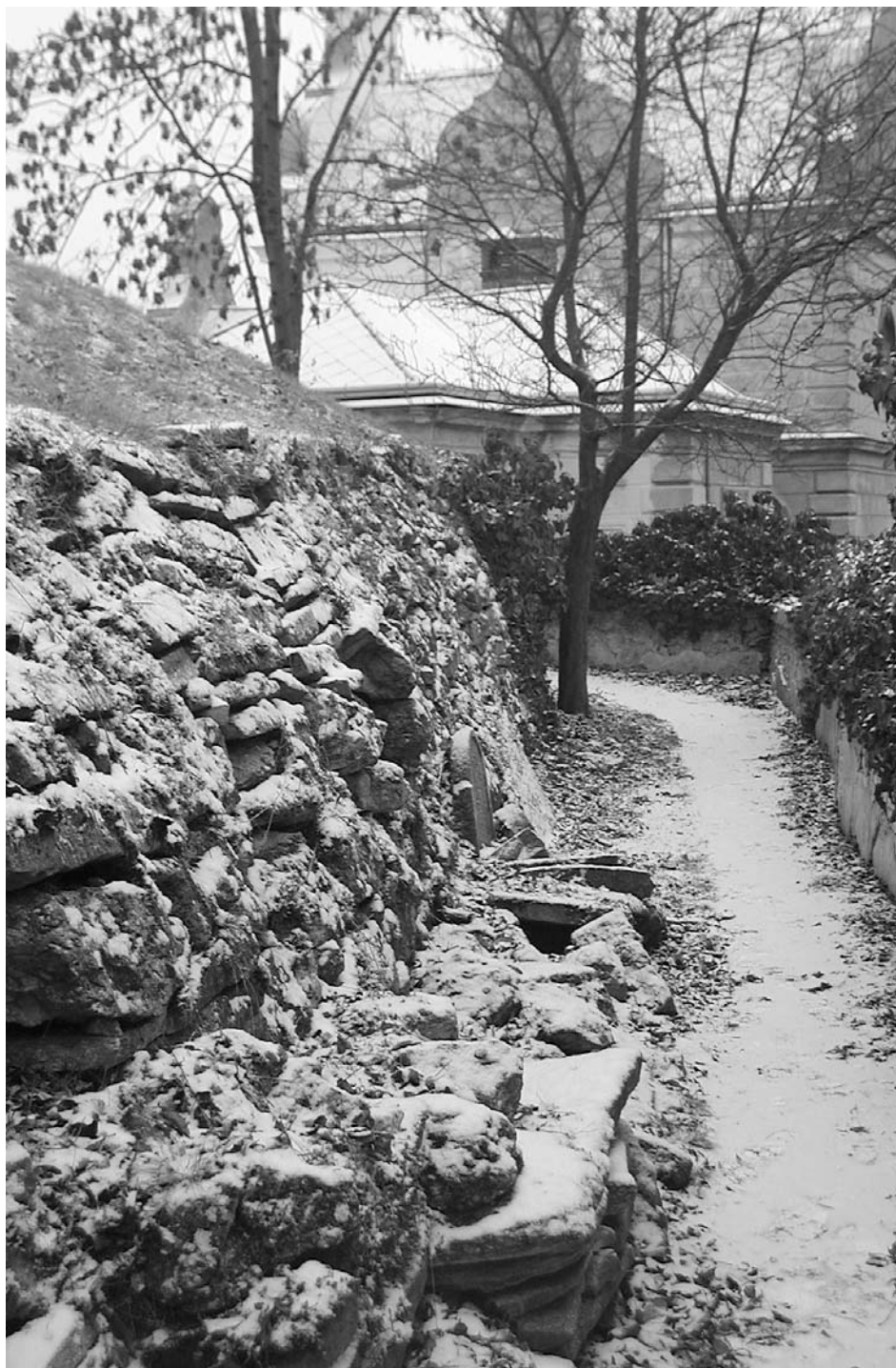
Dolní část tzv. tarasu na severozápadní straně hřbitova.